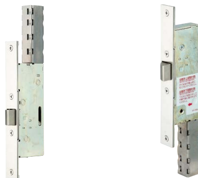
写真は上部ユニット AFB02-U型