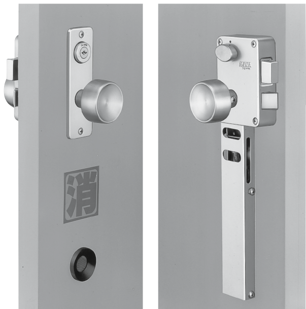
写真はU9KW-5型 (外開き右勝手を示す)